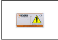
R99/C/001 Uithangbord "Automatic Opening".