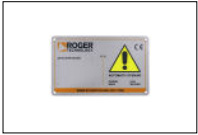
R99/C/001AL Uithangbord "Opent automatisch". Aluminium versie.