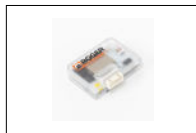
B74/BCONNECT vers. HW2

Tandwiel ¾ Z13 van aanpassing aan Tandwiel ¾ Z16.